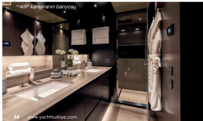
-VIP kamaranın banyosu