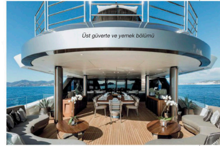
Üst güverte ve yemek bölümü