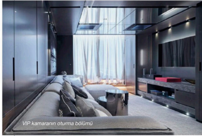
VIP kamaranın oturma bölümü