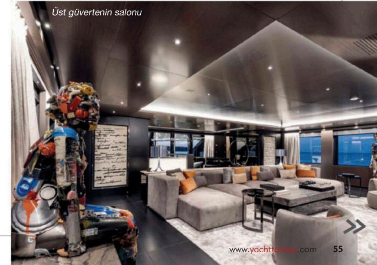
Üst güvertenin salonu