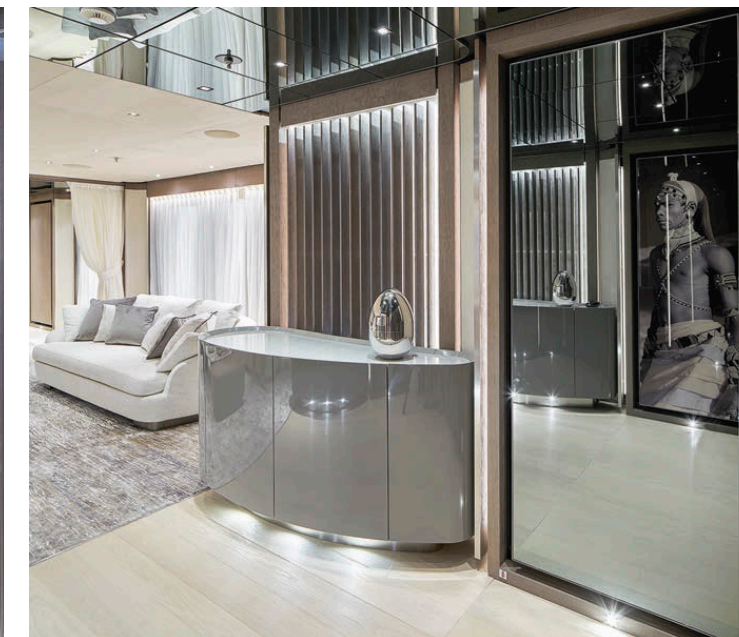
Слева В столовой и главном салоне продуманная система освещения настраивается через iPad.