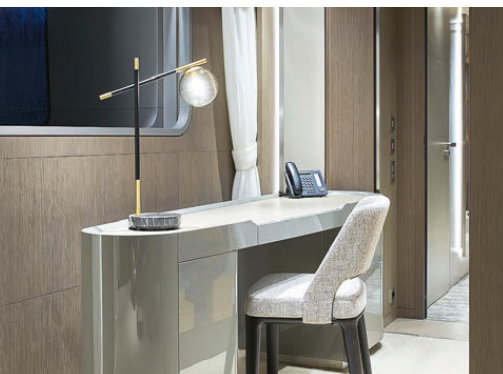
Вверху Мастер-сьют расположен на главной палубе. Слева Кабинет владельца – неотъемлемая часть мастер-сьюта. Справа Во всех каютах яхты удивительно деликатное сочетание респектабельности и уюта.